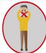
РАК ГУБЫ, ЯЗЫКА